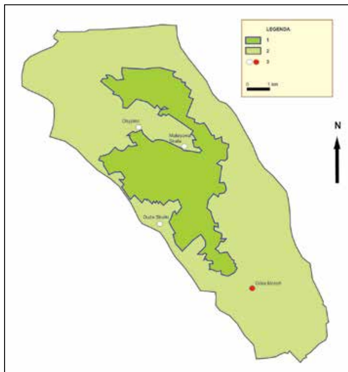
Ryc. 1. Położenie Góry Moroń