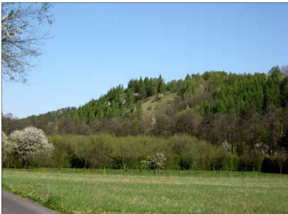
Ryc. 2. Góra Moroń, 25.04.2009 r.