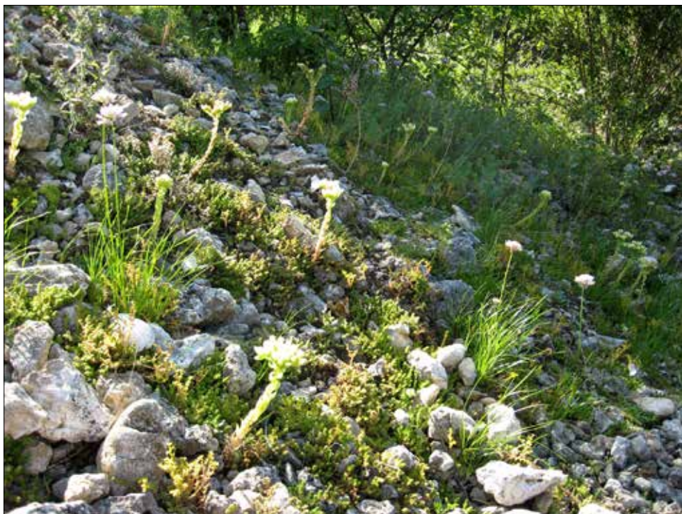
Fig. 7. Vegetation on the limestone talus, 8.08.2009.